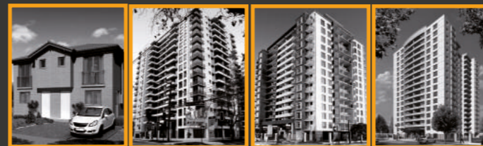
Casas Jardín de Maipú Edificio Dublé Infante Edificio Antonio Varas 2171 Edificio Dublé Almeyda