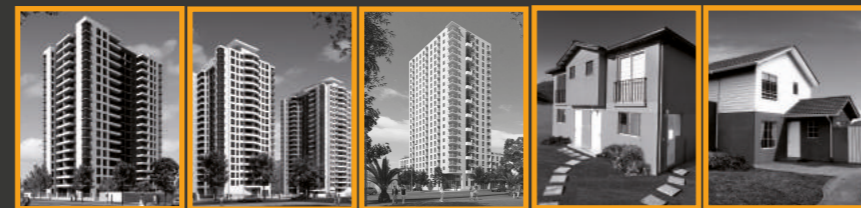
Edificio Milano Condominio Vicente Huidobro Edificio Matta Valdés Casas Jardín de Renca Casas Oeste